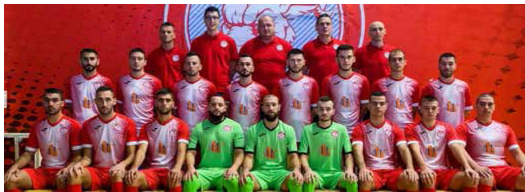
Slika 3. Futsal klub Salines Tuzla City