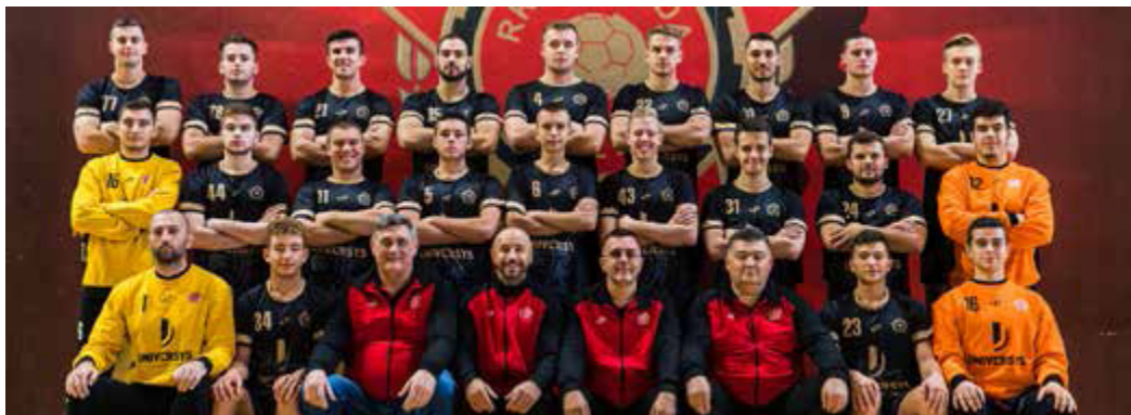
Slika 4. Rukometni klub Sloboda

Značajan broj klubova sa područja Tuzlanskog kantona takmiči se u prva dva sistema takmičenja u BiH kako slijedi: 2