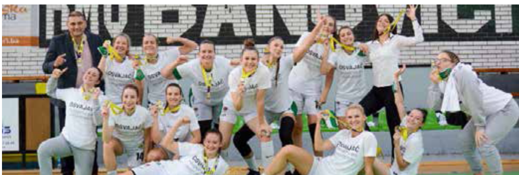
Slika 2. ŽKK RMU Banovići