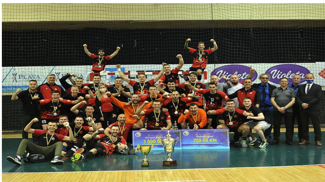
Slika 2. Rukometni klub Sloboda

Značajan broj klubova sa područja Tuzlanskog kantona takmiči se u prva dva sistema takmičenja u BiH kako slijedi: 3